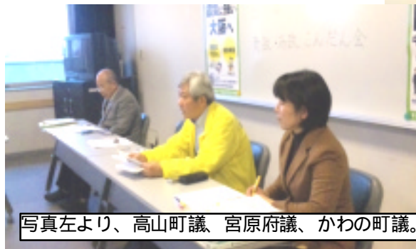
写真左より、高山町議、宮原府議、かわの町議。