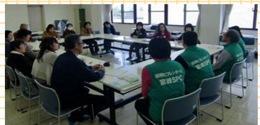
2011年3月19日 自殺防止推進協力員研修 東臼杵郡門川町